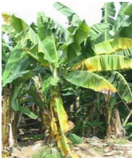
Fig. 1. Amarillamiento de forma ascendente.

Mal de Panamá ( Fusarium oxysporum f. sp. cubense raza 4)