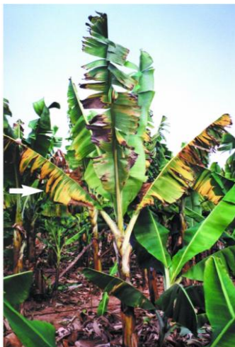
Fig. 6. Síntomas externos por Fusarium: amarillamiento uniforme y pronunciado de la hoja.