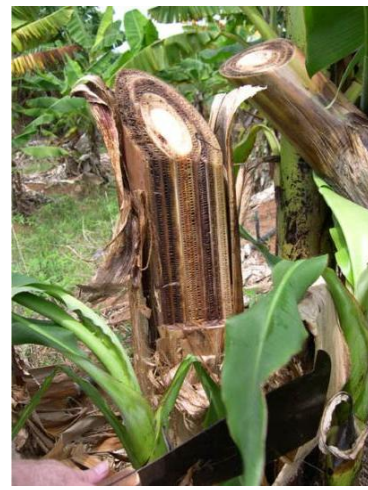
Fig. 4. Decoloración del pseudotallo en una infección avanzada.