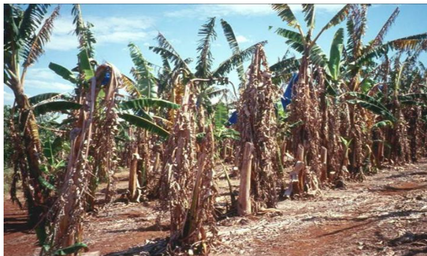
Fig. 5 Síntomas externos avanzados en banana.