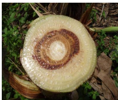
Fig. 5. Decoloración del pseudotallo causado por el mal de Panamá.