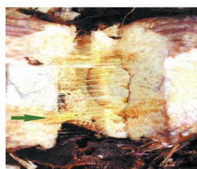
Fig. 5 Corte transversal: manchas amarillas y filamentos amarillos.